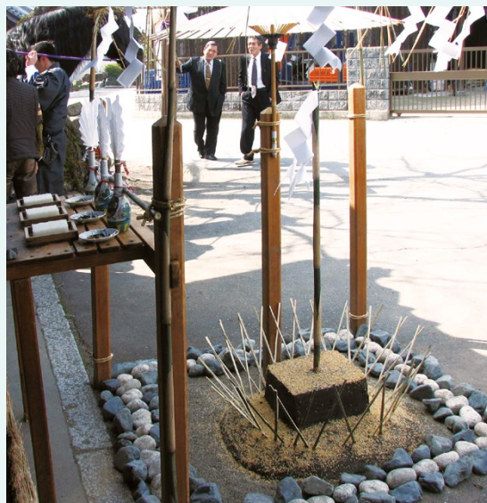
東近江市妙法寺のおはけ

人の家に神霊を迎えるために設けられたものと思われるが、社会的にはその家が頭屋であることを示す存在であったと考えられる。その場所は当初の頭屋の家から公民館前などに移動し、それも近年では設けられなくなる傾向がある。その意味でも多賀大社のじんぼやの存在は貴重である。