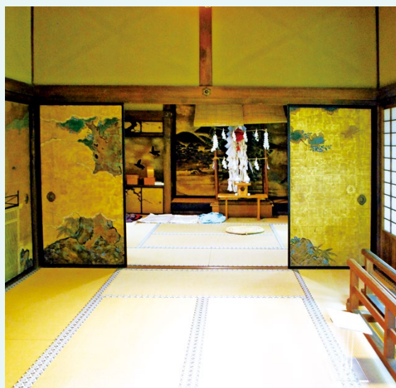
奥書院のじんぼや

多賀大社のじんぼやに類するものは、各地の宮座儀礼で時折見ることができ、これらは「おはけ」と呼ばれることが多く、滋賀県では東近江市河桁御河辺神社の御河辺（みかべ）祭や、同市春日神社のゆきかき祭でみられるもの知られている。前者は祭に参加する集落によって差異があるが、四角く切り取った田の土を積んだものを主体とし、その前に供物台、後ろに番傘を立てるものが多い。また後者は竹と柴で垣